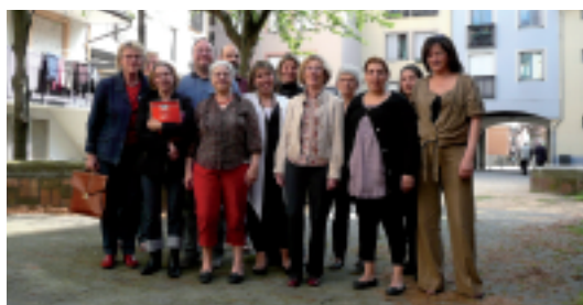
Les associations du quartier Alma Très Cloîtres réunies par l'association Communic'action