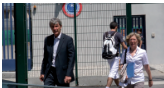
Maison d'arrêt de Varcis en juillet 2010 avec Michel Issindou, Député, dans le cadre du droit de visite des parlementaires pour évaluer les conditions d'incarcération