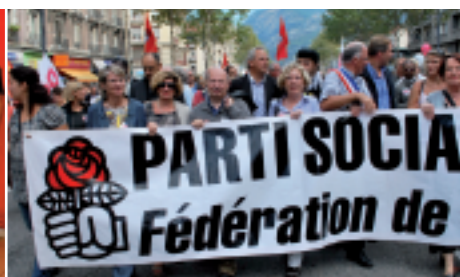
Aux côtés de mes collègues parlementaires, élus locaux, militants, tous mobilisés contre la réforme des retraites proposée par le gouvernement