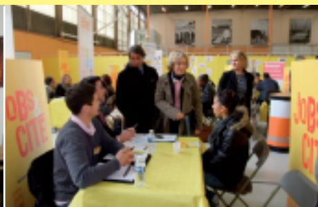
« Jobs et Cités » à Jouhaux : rapprocher les jeunes des employeurs pour l'accès à l'emploi