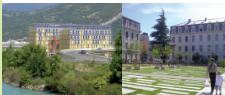
Place Le Ray à la Caserne de Bonne