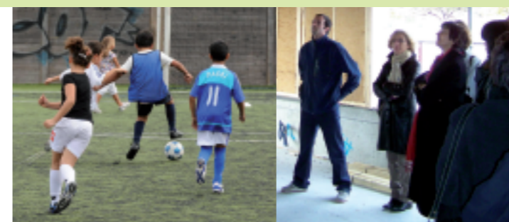
Le pôle enfance à Saint-Nazaire-Les-Eymes